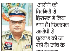
आरोपी को चिरमिरी से हिरासत में लिया गया है। फिलहाल आरोपी से पूछताछ की जा रही है। जांच के बाद खुलासा करने के साथ ही विधि सम्मत कार्रवाई की जाएगी।