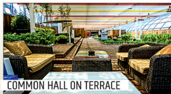
COMMON HALL ON TERRACE