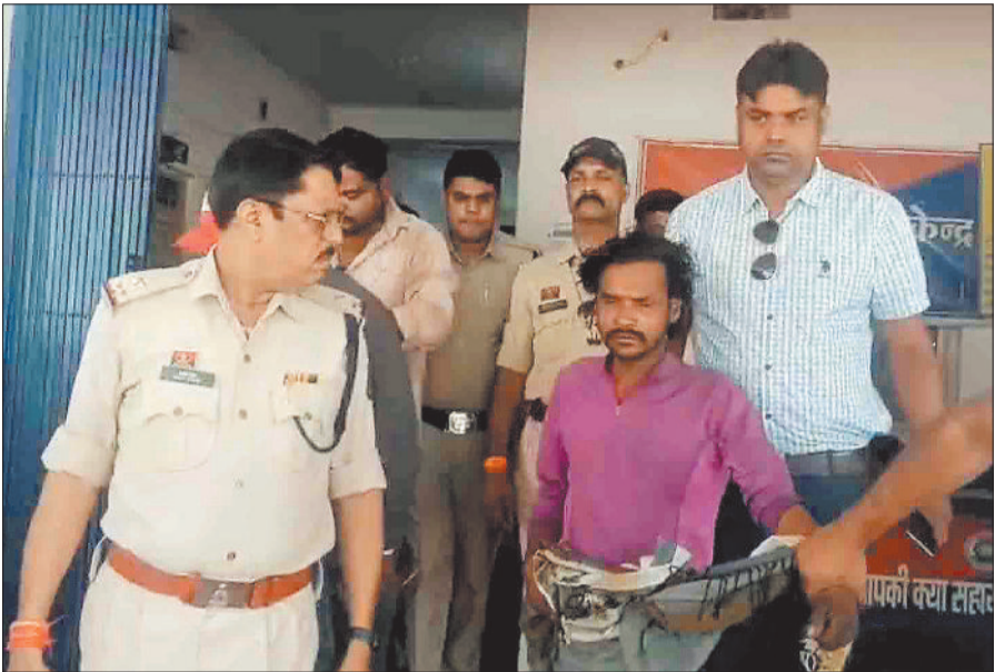
पुलिस गिरफ्त में आरोपी।

महिला के साथ दुष्कर्म करने के बाद उसकी बेरहमी से हत्या करने वाले आरोपी को आखिरकार पकड़ लिया गया है। 35 हजार का गिरा पता रखा था इनाम, जांच जारी आठवें दिन किया गया है। आरोपी को चिरमिरी पुलिस ने हिरासत में लिया है। आरोपी के पकड़े जाने के बाद सरगुजा पुलिस ने भी राहत की सांस ली है। पुलिस आरोपी को एमसीबी जिले से लेकर सरगुजा आई है और उससे पूछताछ की जा रही है। अधिकारी जल्द ही इस मामले का खुलासा करने की बात कह रहे हैं। बड़ी बात यह है कि आरोपी पर 35 हजार रूपए के इनाम की घोषणा की गई थी इसे पकड़ने में पुलिस की पुरानी पद्धति मुखबिर और सूचना तंत्र ही काम आई।