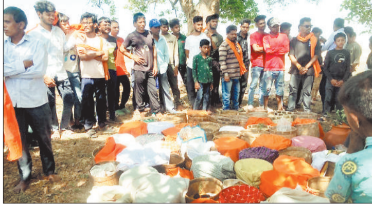
कोठारी पूजा करते ग्रामीण।

इस अवसर पर गांव के लोग काफी संख्या में जुटते हैं। जिले में पुरानी परंपरा का निर्वहन करते हुए विभिन्न ग्रामीण क्षेत्रों में हर्षोल्लास के साथ शनिवार को कोठारी पूजा किया गया। इसके साथ ही अन्य जगहों पर तय समय पर कोठारी पूजा का आयोजन किया जाएगा। जानकारी के अनुसार मानसून आने के पूर्व गर्मी के दिनों में ही कोठारी पूजा ग्रामीण क्षेत्रों में किया जाता है।