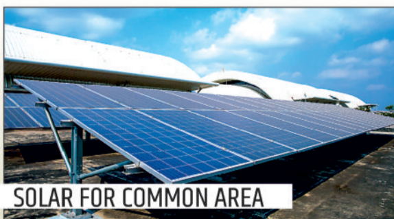
SOLAR FOR COMMON AREA

Site Address: Science College, Shanichari Road, Along Vijayapuram Colony, Bilaspur, Chhattisgarh.