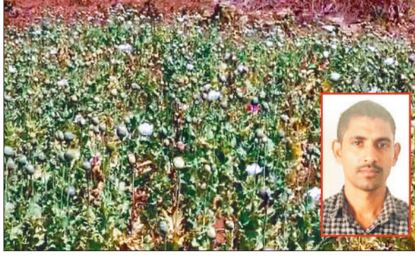
अफीम की खेती, इनसेट में आरोपी।